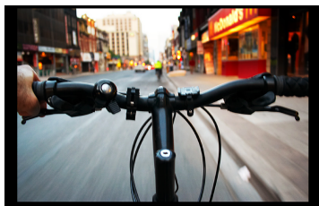
（Point of View Shot、主観性）