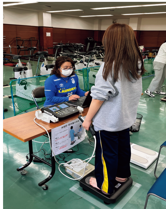
図 1 身体組成の測定風景

握力の測定は、上記要項に記載されている方法で実施し、デジタル握力計 (T.K.K.5401、竹井機器工業株式会社) を用いた。対象者は、左右交互に 2 回ずつ、いずれも全力で試技を行った。測定の際、対象者は直立姿勢で