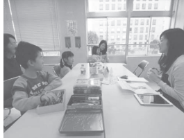
【場面② 授業開始、自己紹介】