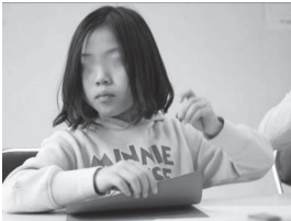
【場面⑤ 画用紙を半分に折る】