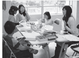
【場面⑦ 切れ込みを中に折り曲げる】