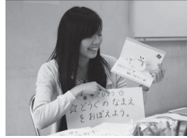
【場面③ アクティビティの内容説明】