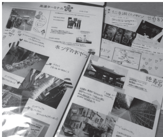
図1 Kクラスの学生たちが作成したパンフレット