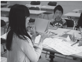
【場面⑧ 2枚の画用紙をのりで貼る】