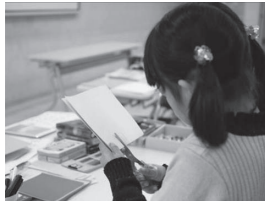
【場面⑥ 切れ込みを入れる】