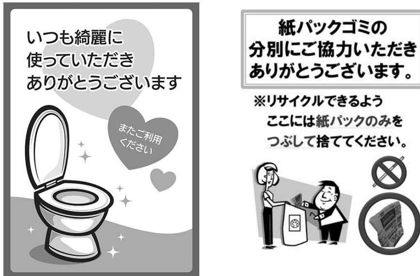
図1 感謝の貼り紙（感謝メッセージ）の例

注) 左図はヤマト広告株式会社HP掲載の貼り紙 ( http://yamato-agency.com/ )、右図はYuo & Yoshida (2010) の社会的迷惑行為の観察実験で用いられた貼り紙です。