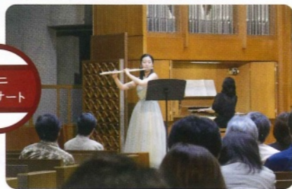
音楽科によるミニコンサート