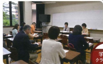
学科別クラス懇談