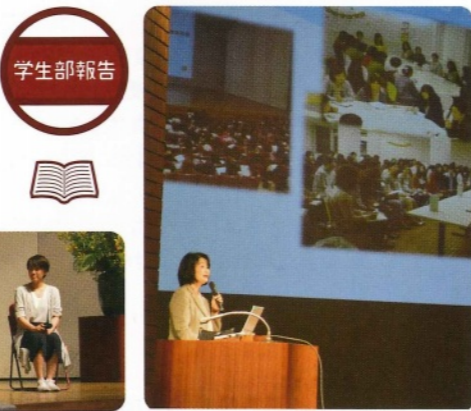
キャリア支援部長による就職状況報告