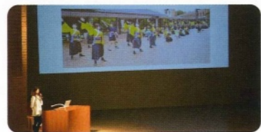
学生部長による学生生活に関する活動報告