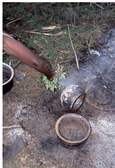
仕上げの薬草の液体をかける