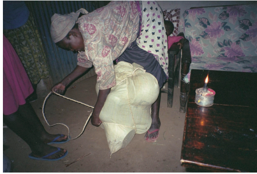
丁寧に、割れないよう梱包する