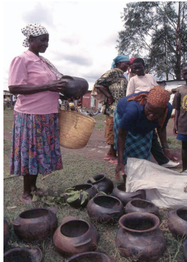
マーケットでの販売