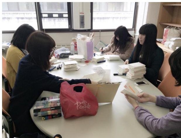
プラン・ジャパン、【シエラレオネの母子が安心して迎える出産プロジェクト】ハガキ仕分け風景(1)