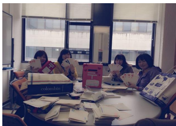
プラン・ジャパン、【シエラレオネの母子が安心して迎える出産プロジェクト】ハガキ仕分け風景(2)