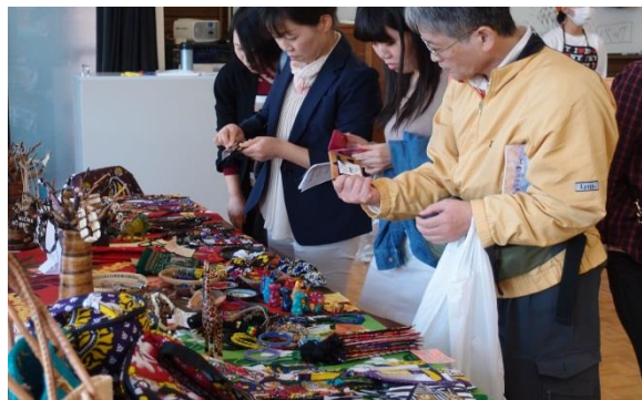
商品を手取るお客様