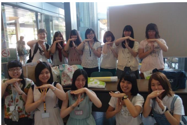
仙台地球フェスタ (2)