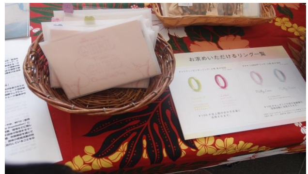
どこで販売しても大人気だったピンキーリング♥

今年度の良かった点、悪かった点を生かしながら、来年度は、私たちは何を目的とするのかを再確認し、メンバーたちの意見を聞きながら活動をもっともっと盛り上げていきたいと思っています。これから、もっともっと沢山の人に出会い、みんなで学び、考え、行動し、少しでもいい国際協力になる活動を目指してメンバー一同で元気に頑張っていきたいと考えています！！