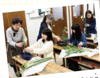
より魅力的な作品にするよう 先生からアドバイス