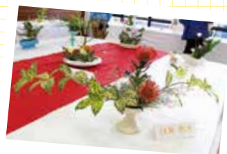
大学祭で展示された作品

生け花の魅力は、植物にいろいろなアレンジを加えて、美しく仕上げる場所。先生からは「花はモデル、生け手はカメラマンになったつもりで、いかに美しく仕上げるかを考えながら、表現するように」とアドバイスを受けています。「年配の人や器用な人がやるもの」といった先入観から敬遠されがちな生け花ですが、若者ならではの生け方をしたり、作品をSNSにアップしたりして、今後は生け花の楽しさ・すばらしさを発信していきたいです。