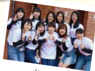
発表前の ピラ配ソングの1シーン