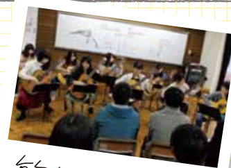
毎年多くの観客が詰めかける 大学祭のミニコンサート

日頃の練習の成果は、大学祭でのミニコンサート（毎年10月）や定期演奏会（毎年12月）などで披露。演奏曲はメンバー同士で相談して、ポップスだけでなく年配の方にも馴染のあるポピュラーな曲も入れています。やはりたくさんの方に聴いてもらえることが、一番のモチベーションですね！ 今後は、演奏を聴いていただく方々との縁を大切にしながら、有意義な時間を過ごしてもらえるようクオリティの高い演奏を届けたいです。