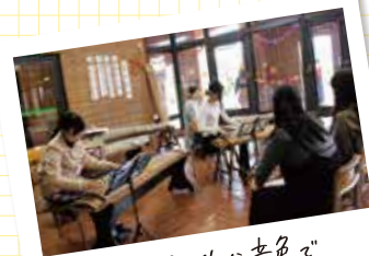
琴の優雅な音色で 聴く人を魅了！

10月に開催される大学祭は、日頃の練習の成果を発揮する場。毎年土曜・日曜の2日間、演奏発表を行っています。ほかにも、来場者の方々に実際に琴を弾いてもらう演奏体験なども実施しています。和楽器は「弾く」機会だけでなく「聴く」機会も非常に少ないもの。だからこそ、多くの方々に和楽器、特に琴の魅力を知ってもらい、興味を持ってもらえたらうれしいです。