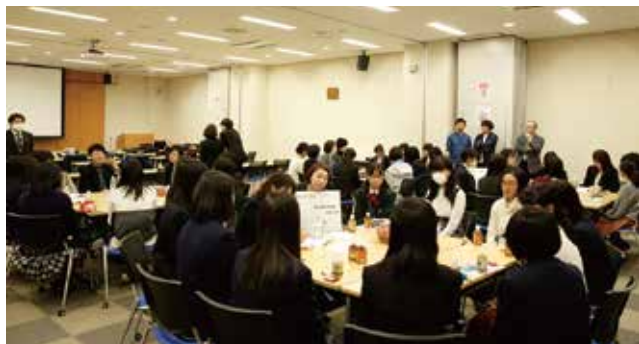
さまざまな意見が交わされたグループディスカッション

第2部は4グループに分かれ、OGと高校生によるディスカッションが行われました。各グループが話し合うテーマは、どんな女子力をどのように生かせば「宮城の企業がもっと元気になるか」「宮城をより子育てしやすい県にできるか」「宮城を健康大国にできるか」「宮城の伝統・文化を次世代に伝えられるか」といったもの。 この日初めて会った高校生が「宮城の未来について語り合う」という難しい課題でしたが、そこは「女子の底力」を発揮。OGのリードもあり、次第に活発な意見交換が行われるようになりました。 発表では、グループの代表者から「コミュニケーション能力・発信力・発想力・繊細さ・美意識・気配り」などの女子力を生かした提案が次々に出され、実り多いワークショップとなりました。