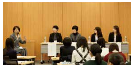
高校生に「女性としての生き方、働き方」について語るOG