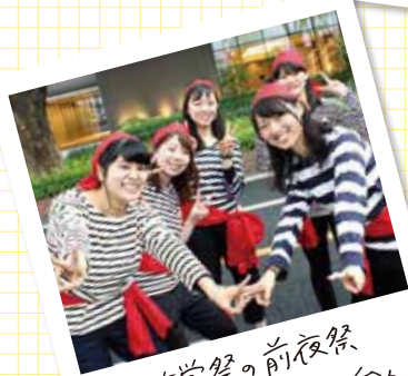
大学祭の前夜祭 「仮装パレード」にも参加！