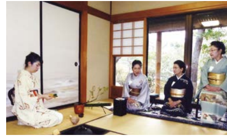
2016年の初釜。義母の教えて無心にお茶を点てる

「伊達精進懐石 雲外」は料理やお茶が好きだから、やってみたら」という夫の助言で私の代に始めました。食通の伊達家