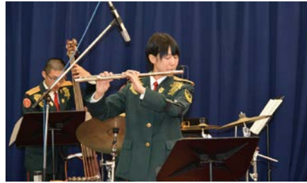
憧れの演奏服を着ての演奏に引き締まる思い

その後、卒業を控え、音楽と無関係の仕事に就くことも考えていたとき、陸上自衛隊音楽隊の演奏会に出掛けました。会場は霞目駐屯地のヘリコプター格納庫でしたが、子どもからお年寄りまで全員が楽しそうに演奏を聴いている姿に感動しました。迫力ある音、凛々しい姿、厳格な演奏。それは、自分のためではなく人を元気づけるための演奏で、「私がやりたいことはこれだ。音楽隊に入りたい」と、決意しました。