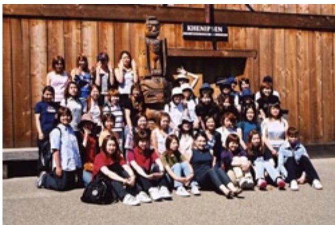
Native Cultural Centre in Duncan

私達に通っていた語学学校は雰囲気良く先生方も親しみやすくとても学びやすい学校でした。Placement Test によって自分のレベルに合ったクラスで勉強するので無理なく学べます。この学校の特に良いところは、少人数制クラスだということだと思います。各クラスの人数が約7、8人なの