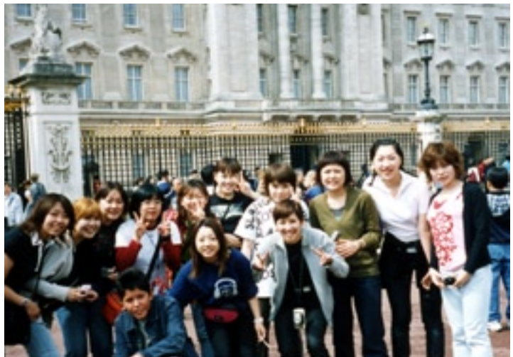
バッキンガム宮殿の前で

★ロンドンでの生活★ ロンドンでは学校の寮のようなところに泊まりました。主に観光中心で、国会議事堂やロンドン・アイなど、各名所をガイドさんの解説付きでまわりました。自由行動では、各自ショッピングなどを楽しみ、最後の夜には、皆で『ライオン・キング』や『マイフェアレディ』などの演劇を鑑賞しました。私のロンドンでの一番の思い出は、体を張ってのぼったセント・ポール寺院からロンドンを一望したことです。おすすめスポットです。